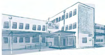
IES DOLORES IBÁRRURI FUENLABRADA