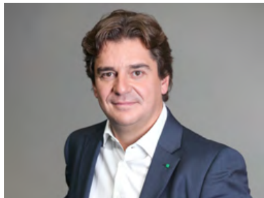
Javier Ayala Alcalde de Fuenlabrada